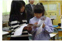
郡山市立明健中学校 行健第二小学校 明健小学校 小泉小学校

研究主題『対話を通して学びを深め・高め合う子どもを目指して』を受け本校の副主題として「互いに学び合う場の充実を通して」に向けて、授業実践を行いました。HP上に案内しましたが、1/24～1/30まで郡山市中央公民館で展示会が行われました。