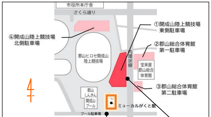
ミュージカルがくと館周辺図