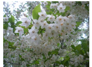
【エゴノキの純白の花】

学校の周りには、今、エゴノキが白い花を咲かせています。特に逆光で見ると大変美しい花です。やがて、花の数だけ、緑の実になります。