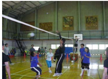
【白熱したゲームの様子】