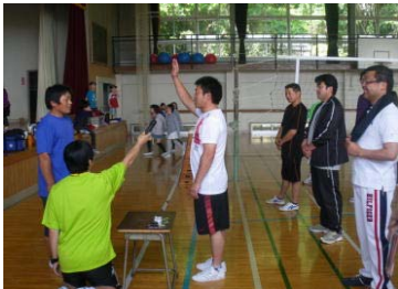
【6学年委員長の選手宣誓】

優勝は、4、6学年チームでした。怪我もなく、親善の目的が100%達成出来ました。担任も一緒にプレーでき、気持ちの良い汗を流させていただきました。