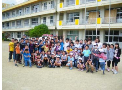
【記念写真を撮りました】