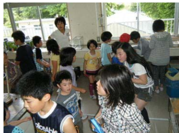
【なかなか見つかりません】