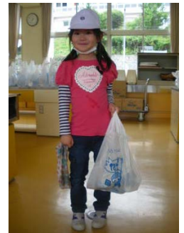
【郡山市から配布された「がくとくくん」袋に詰めて、持ち帰りました。】