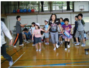
【清掃班縦割り班で！】

6月15日(水)、全校集会で「室内オリエンテーリング」を行いました。縦割り班に分かれ、校舎内に貼られたスコアのカードを見つけました。制限時間は20分で、見つけた数によって点数が決まります。ゴールの時間が遅れても減点されます。どの班も上級生と下級生が仲良く協力し合っってスコアを見つけ、楽しい活動となりました。