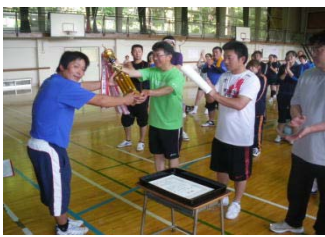
【優勝チームへのトロフィー贈呈】