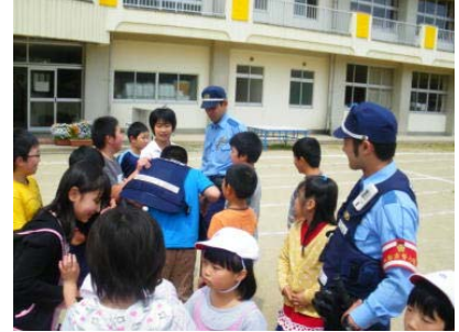
【お巡りさんと仲良しに】