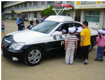
【パトカーは人気です】

6月15日(水)昼休み、災害支援のため郡山市内で警備活動をしていた福岡県警の警察官2名が、任務を終えて戻ることになり、市内の小学生に最後のお別れをしたいと本校に来られました。福岡県とは郡山市の開拓をした歴史があり、郡山市の久留米等の地名に感動したと語っていました。その久留米ナンバーのパトカーの中に代表の児童が乗り、パトカーの仕組みを教えてくださいました。福岡弁のお巡りさんとふれあい、最後に記念写真を撮ってお別れしました。遠くまできていただき、郡山市の防犯を支援していただき、感謝です。