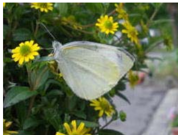
【放したモンシロチョウは、しばらく羽根を乾かし飛んでいきました。】

6月17日(金)3年生の子どもたちが理科の学習で飼育したモンシロチョウを放しました。2匹とも元気に飛んでいきました。子どもたちは大喜びでした。生命を大切に心が芽生えた瞬間でした。