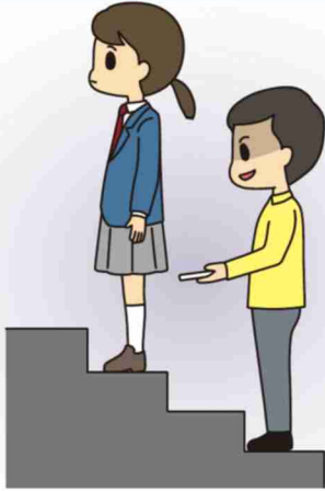
下着を盗撮された…