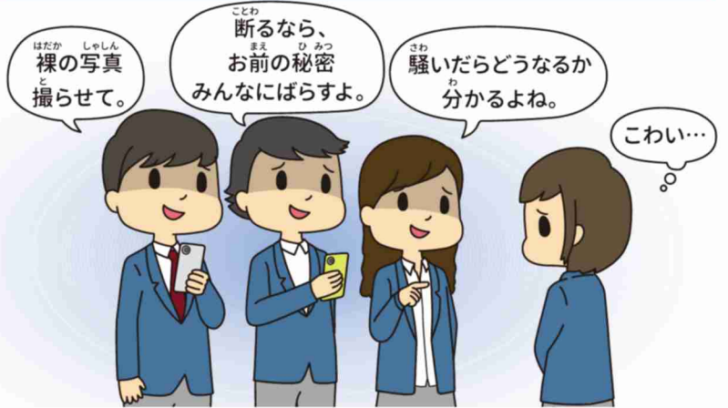
裸の写真を撮られてしまった…