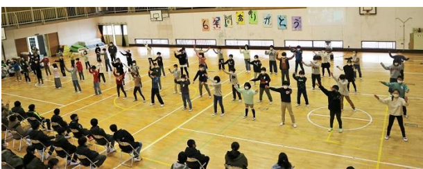
<4年生のダンスパフォーマンス>