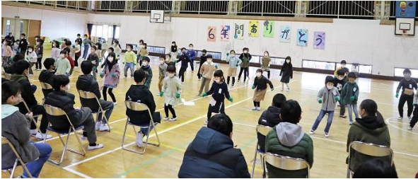
<1年生のダンスパフォーマンス>