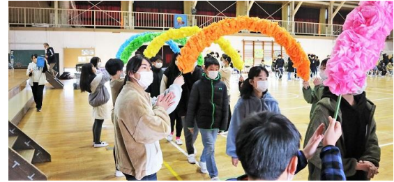
<5年生による6年生の見送り>