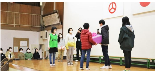
<6年生から5年生の引継ぎ>