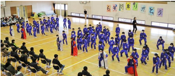
<3年生の応援団パフォーマンス>