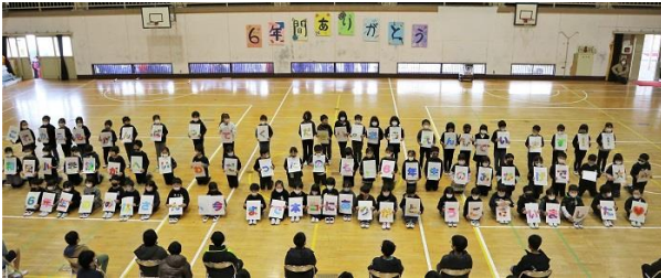
<2年生の人文字パフォーマンス>