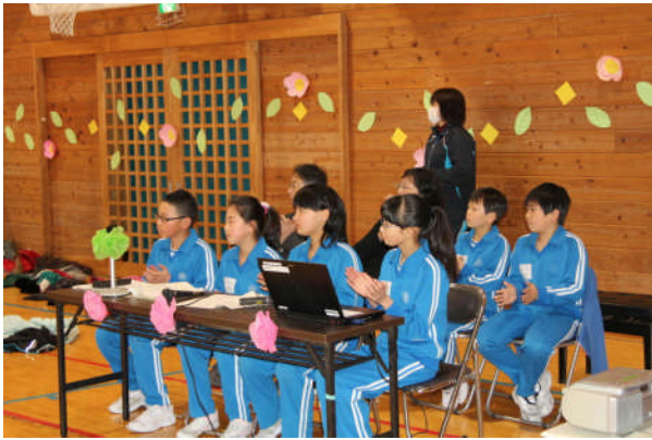
進行，音楽係のみなさん