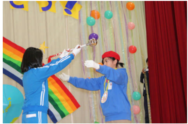
A・Kさんへの指揮杖の移杖