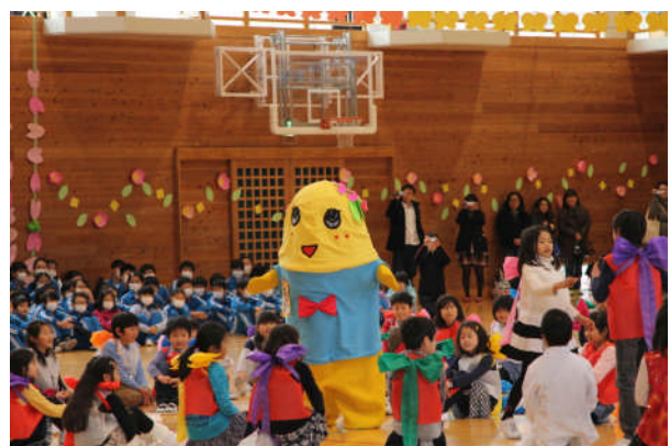
3年生 ふなっしーも登場!?