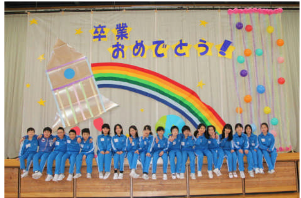
実行委員会のみんなご苦労様！