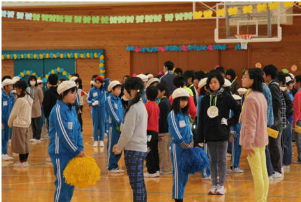
各パートごとの引き継ぎ