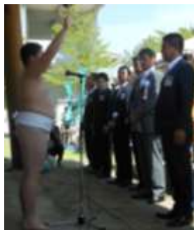
本校選手の選手宣誓。緊張します。大変な役割です。一つ一つしっかりと乗り越えています。応援します。