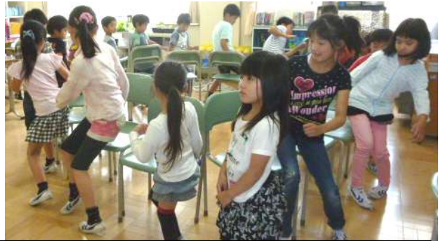
いすとりゲームです。