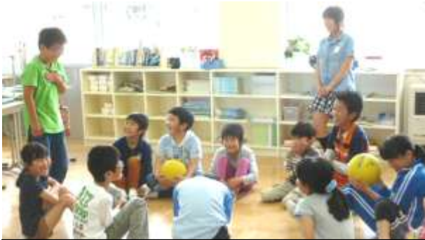
みなさん！！僕の説明を聞いてください・・・

「なかよし開成っ子」は、校外子ども会ごとに異学年の子どもたちが交流を深め、連帯感を醸成するとともに「思いやりの心」を育む大切な取り組みです。5・6年生がリーダーとなって企画・運営し、ゲームや清掃活動を通して、みんな「なかよし」になりました。