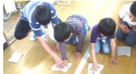
拭き掃除は、膝をついて、力をいれて、そうそうじょうずだね。