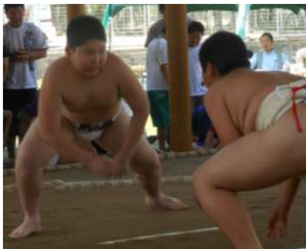
どすこい・・・いい表情です。