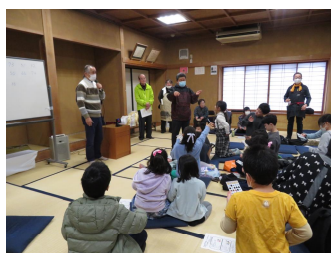
ビンゴゲームに無我夢中です。