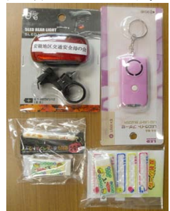
【寄贈されたグッズ】

3月8日(金)永盛交通安全母の会会長さんより、交通安全グッズの寄贈がありました。永盛交通安全母の会と地区母の会からの寄贈です。6年生には、自転車の反射板、他には、防犯ブザーや筆記用具など、たくさんいただきました。朝の登校時には、いつも旗当番をしていただき、感謝しております。