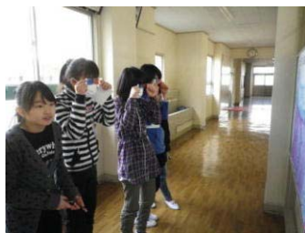
【めがねで覗く子どもたち】

また、大陸プレートとプレートの境(落ち込み)に位置する日本大陸が、地震が多いわけも地形から理解できます。