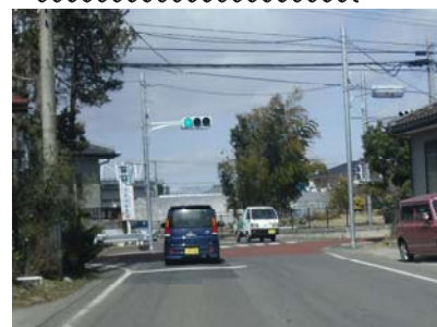
【直進:ピクパレット】