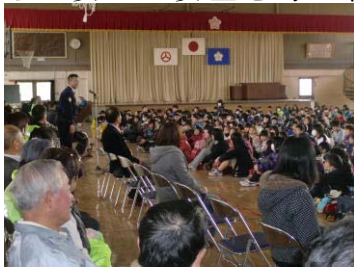
【永盛交番所長さんのご指導等、全体会の様子】

事故防止は、一人一人の意識の問題ですが、その土台として、地域の方々真剣に子どもたちの安心・安全を考え、具体的な行動で示していただけることに感謝いたします。