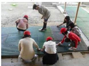
【体育館渡り板清掃】

永盛フェスタを支えた6年生。フェスタ前日は、全員で、力仕事、清掃活動、係の教師の手伝いと一生懸命に活動する子どもたちの姿がありました。10月30日（火）も体育館の整理整頓など、一生懸命に仕事をしていました。各学年の発表も立派でしたが、このような陰の力がフェスタを成功させる最も大切な事であると思います。