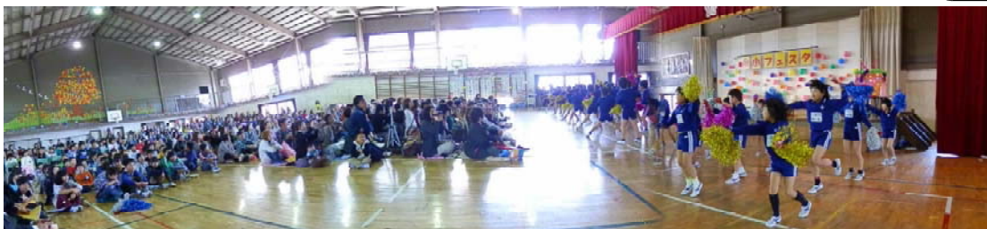
【2年生：秋だ！祭りだ！みんな集まれ！】

※たいへん長い絵本の群読に感動しました。演技が暗唱でき、動的な感じを演出していました。