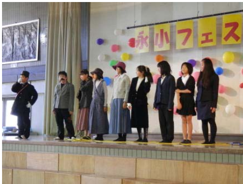
【5年生：ミニオリンピック】

※音楽、体育を交えた発表でした。跳び箱や組み体操、なわとび（ダブルダッチ）等の演技を真剣に行う子どもたちの顔が、きらきら輝き、素晴らしかったです。