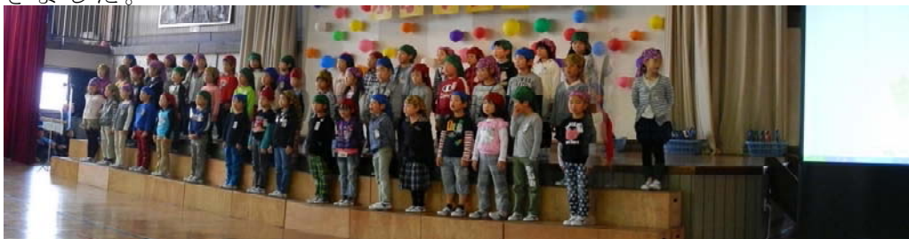
【1年生：1年生物語 群読】

先日の永小フェスタには、保護者の皆様・地域の方々に多数お出でいただき、感謝申し上げます。各学年に応じた特色ある学習成果の発表でした。天気にも恵まれ、無事終了できました。