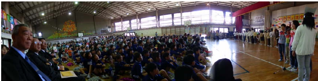
【3年生：英語劇「THE BIG TURNIP」】