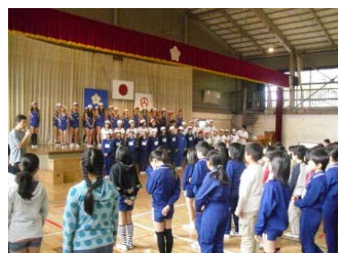
【種目ごとの自己紹介】