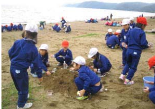
【1,2年：館浜で、思い思いの砂の芸術】

3学年は、布引高原で諸活動を予定していました。バスで布引高原に上りながら、途中下車し、有名な神社や地藏様、大きなカツラの木等の説明を聞きました。「風の高原」では、「ぐるっと湖南伝承会」の方に風力発電などについての説明を聞きました。その後、あいにくの天候(もや・気温14℃・風)のため、一部活動を中止して、旧月形小学校へ移動。校舎内で昼食、伝承遊び等を楽しみました。