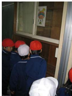
【がくと君を探そう】