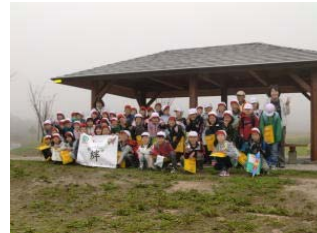
【3年生：布引高原の学習と記念撮影】