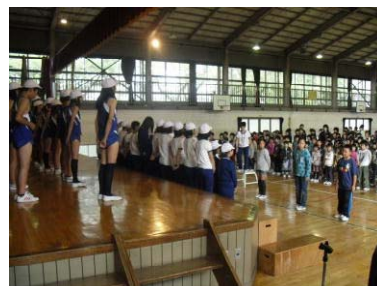
【運営委員会によるエール】

10月10日(火)、郡山市内小学校陸上交歓会(10月11日)に出場する6年生の壮行会を行いました。朝、放課後と一生懸命に練習を重ねてきた子どもたちのがんばりに期待しています。