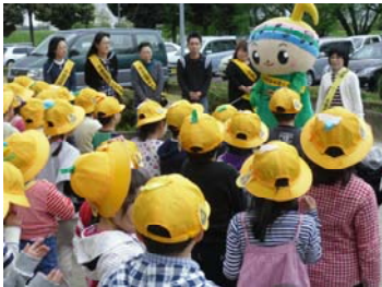
【「はひふへほ」で交通事故防止】

5月11日(金)1,2年生の交通安全教室を行いました。登校・下校時を中心とした一般道路の歩き方・安全確認の仕方について、学習しました。永盛交通安全母の会の方々にご指導をいただき、学習を進めることができました。学校から日の出橋を渡り、信号機のある横断歩道を2回横断し、再び学校へ戻るコースで行いました。学年ごとにグループで時間差を付け、歩きました。要所に7名の母の会の方々が付き、実地指導を行いました。「がくとくん」も駆けつけ、交通安全を呼びかけてくれました。