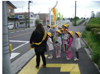
【信号機のある交差点での指導の様子】