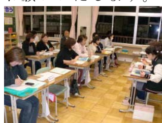
【各専門委員会の真剣な話し合い】