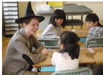
【お互いに自己紹介をしている様子】