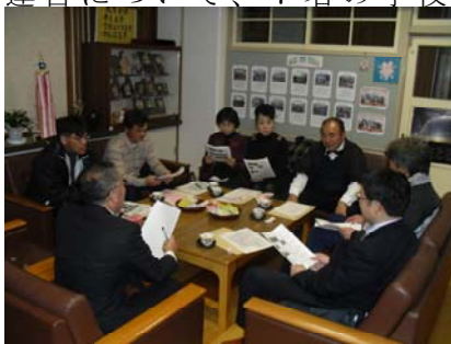
【学校評議員会の様子】

12月9日（金）19：00～、第2回学校評議員会を開催しました。第2学期の学校運営について、7名の学校評議員の方々より、いろいろな建設的なご意見をいただきました。夜遅くまで、話し合いが続けました。