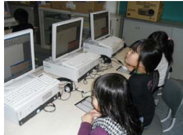
【コンピュータルームでの授業の様子】