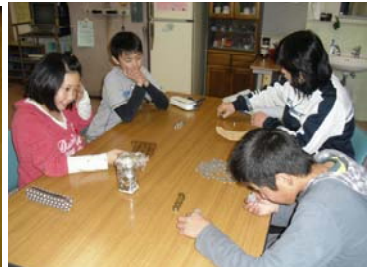
【集まったお金を集計するボランティア委員会】