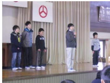
【児童会・運営委員会の説明】

12月14日（水）8：15～、全校集会（ゲーム集会）を行いました。大変寒い日だったので、ジェットヒーターを2台点火しました。児童会運営委員会の子どもたちが、考えた〇×クイズです。学校敷地の桜の数、図書室の本の数、永盛小の男女の数など、問題にあがりました。全問正解の児童もいました。楽しい時間を持つことができました。