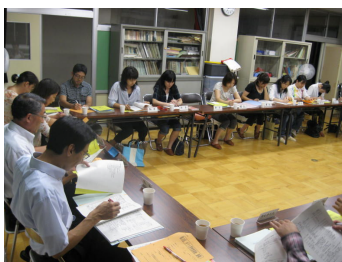
【運営委員会の様子】

第3回 P T A 運営委員会が開催されました。P T A 運営委員の方々が遅くまで、①各専門委員会活動経過報告 ②永小まつり ③市P連南ブロック研修会について熱心な話しがなされました。またP T A 本部役員の方々には、③の資料作成等さらにお世話になりました。