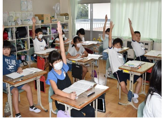
《意欲的に学習の臨む子供たち》

暑い日が続いていましたが、9月後半になりようやく落ち着きを見せ、過ごしやすくなってきました。学校生活も1年の半分が過ぎ、いよいよ後半戦のスタートです。今年立てためあて、2学期立てためあてを振り返り、今後何に力を入れて取り組むべきかを真剣に考え行動することが、自分を大きく成長させてくれます。学校でも子ども達の頑張りを認め、励ましていきますので、ご家庭でも温かい言葉かけを引き続きお願いいたします。集中しやすい環境が整ってきました。一人一人にとって実りの秋となるよう教育活動にあたっていきます。今後ご理解とご協力よろしくをお願いいたします。