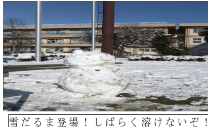
雪だるま登場！しばらく溶けないぞ！