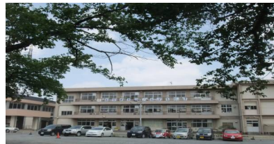
【今年の新緑：5月16日撮影】