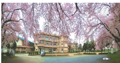
【今年の桜：4月15日撮影】

～運動会の変更点～ ◇ 全校種目(団体)新設(運べ!ぼくらの元気玉!!) ◇ 万国旗設置の廃止 ・万国旗の老朽化 ・PTA・6年児童による作業の負担軽減 高所作業危険回避 前日準備・当日朝の多忙化解消 ◇ 予行の廃止 ・全体練習で対応