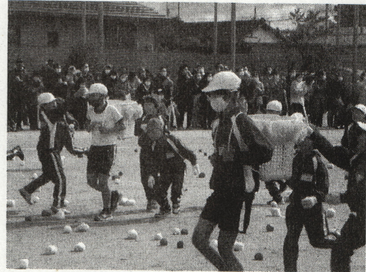
〈1年 追いかっこ玉入れ〉