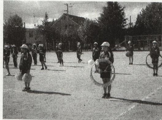
〈6年 小原田小鼓笛隊ファイナル〉