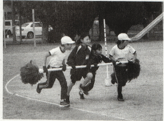
〈4年 小原田ハリケーン〉