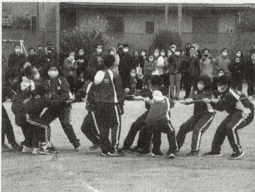
〈5年 クラス対抗 網取り合戦!〉