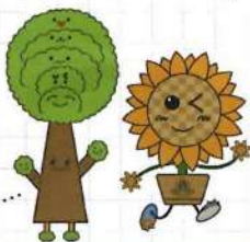
メタちゃん リリちゃん