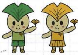
あいちょうくん あいちょうさん